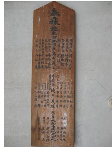
新校舎上棟を記録した木札