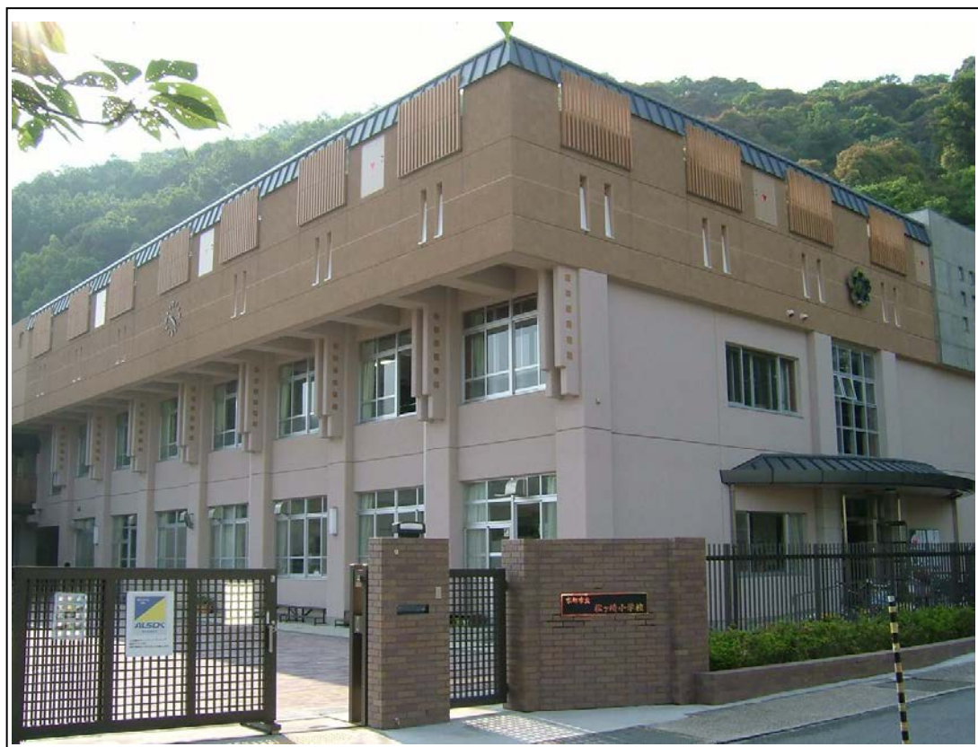
現在の松ヶ崎小学校の正門（屋上がプール）