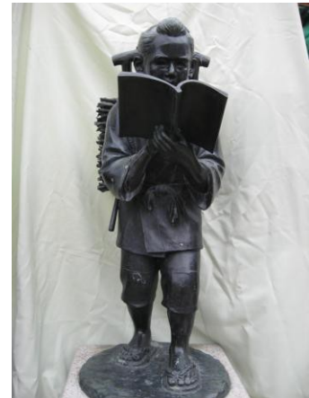
二宮金次郎像（銅製）