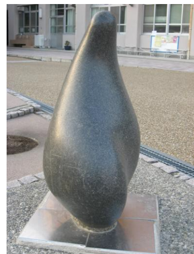
「つるりん」 （山田多朗氏 制作）