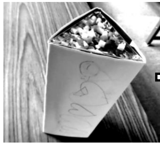
はこの中をのぞくと??