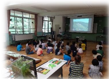
(7/6 3年ヤママユを知ろう)

・放課後まなび教室が、6月28日（月）スタートしました。まだまだ、新型コロナウイルス感染防止対策の徹底が必要です。今年度は参加人数を2・3年生に限定して入れ替え制とすることで3密を回避しながら、子どもたちの放課後の居場所の1つとして教室運営を行っています。