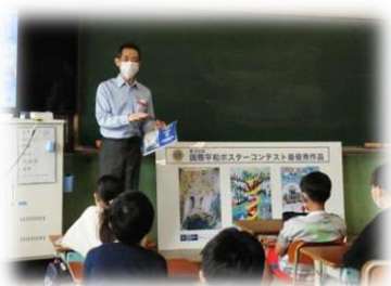
(6/21 6年平和ポスターを描こう)